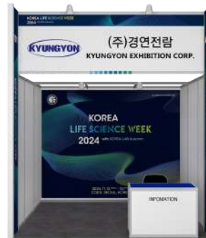
C-타입 - 배너출력 + 족자시공 W 2,930mm X H 2,360mm , W 950mm X H 2,360mm