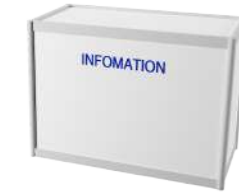
인포메이션 데스크(조립식) Size : 1000x500x750(H)