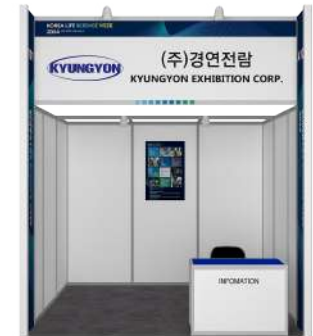
D-타입 - 보드판넬 W 600mm X H 900mm