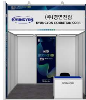
A-타입 - 실사출력 W 970mm X H 2,392mm